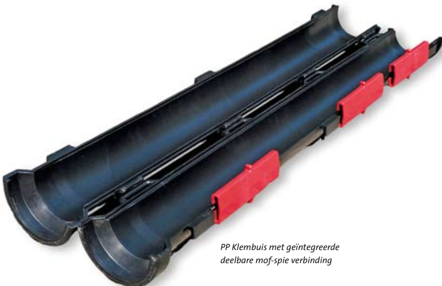
PP Klembuis met geïntegreerde deelbare mof-spie verbinding