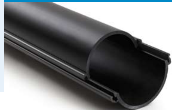
Robuuste HDPE Klikbuis