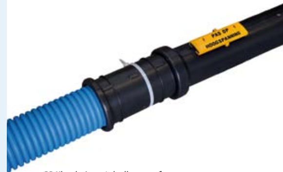
PP Klembuis met deelbare mof aan te sluiten op mantelbuis